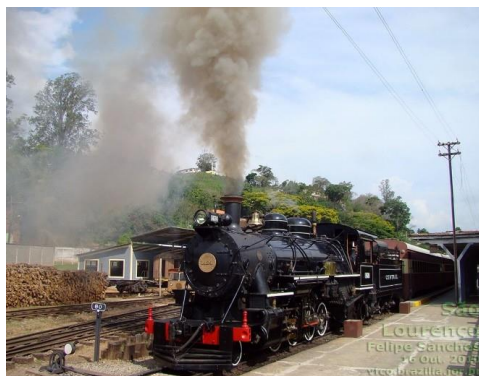
Figura 1: Locomotiva a vapor

Segundo Thompson (2010), existe no mundo em torno de 900.000 km de linhas férreas, transportando 11,4 bilhões de toneladas e empregando aproximadamente 7,1 milhões de pessoas. Estes números variam de acordo com o avanço econômico mundial, em razão do setor de transporte ser muito sensível às situações de mercado aos quais os países se deparam.