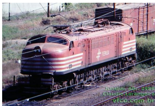
Figura 2: Locomotiva elétrica