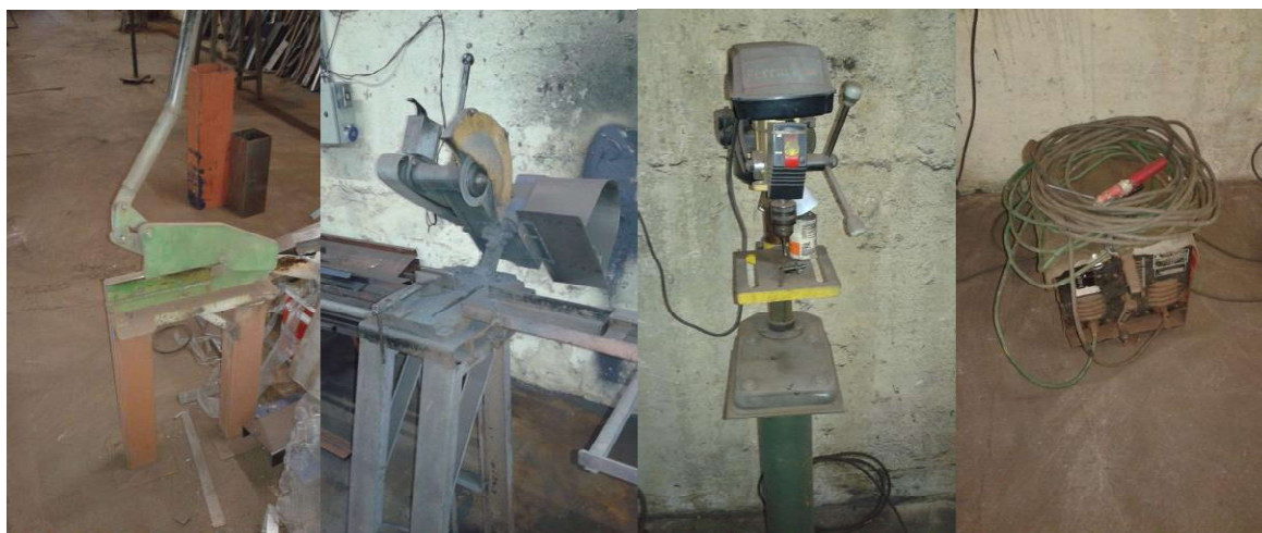
Figura 4: (a), (b), (c) e (d) Equipamentos utilizados na empresa.