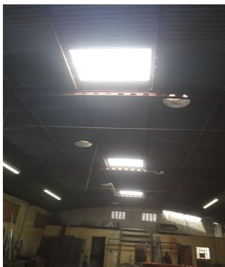
Figura 7: Telhas transparentes

Foram trocadas três telhas por telhas transparentes para melhorar a visualização na área de processo, segue abaixo figura 7 mostrando como ficou a área de processo.