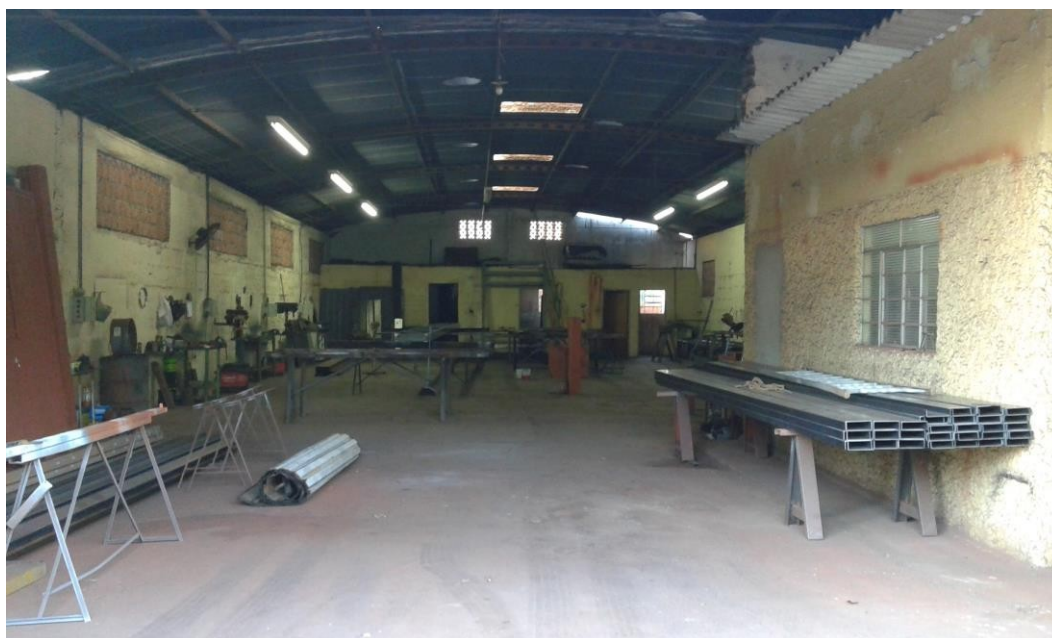
Figura 3: Área de processo e pintura

Na figura 3 mostra a área de processo e pintura, assim como o espaço físico da empresa onde foi localizado riscos físico, químico, ergonômico e biológico, todos classificados com risco médio e risco de acidente classificado como risco grande.