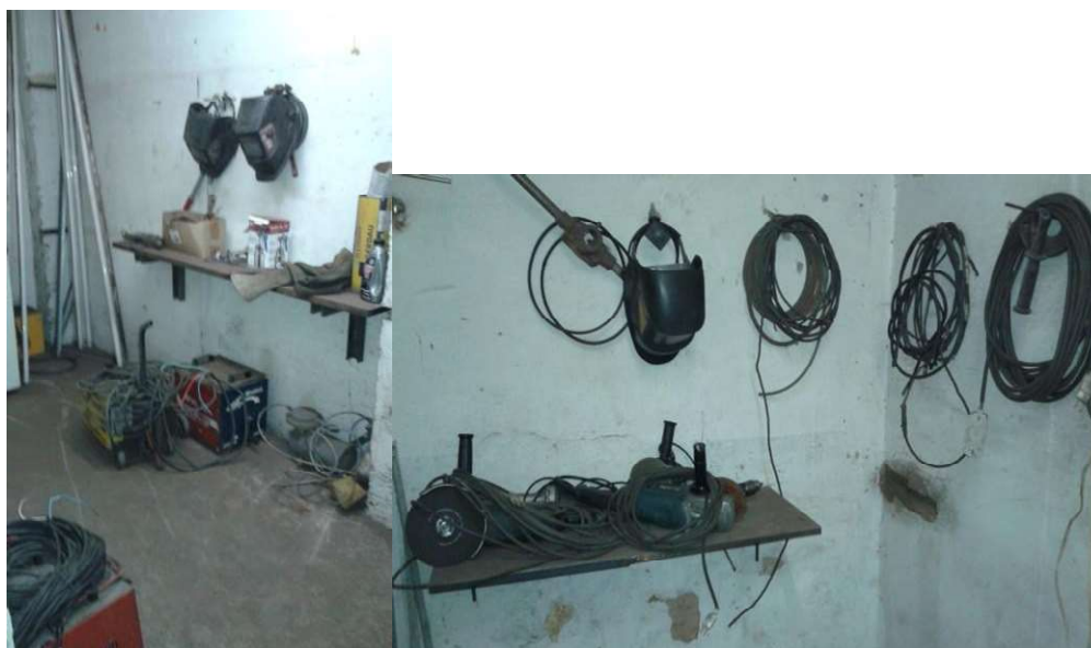
Figura 5: Estoque de materiais e equipamentos.

Na figura 5 mostra o estoque de materiais e equipamentos da empresa.