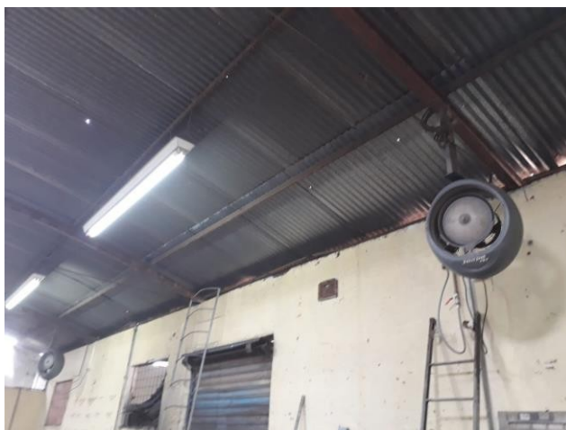
Figura 6: Umidificadores de ar

Foi instalado 2 umidificadores de ar para melhorar o ambiente de trabalho ajudando a amenizar o calor excessivo, assim como demonstrado na Figura 6.