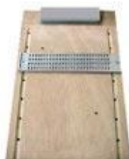
Figura 1: reglete

Ainda segundo a autora, areglete e o punção, foram os primeiros instrumentos utilizados por pessoas com deficiência visual para escrever o braile. Eles eram uma espécie de lápis, mas eram muito lentos e exigiam uma ótima coordenação motora; coisa que as crianças pequenas naturalmente ainda não têm.