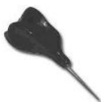
Figura 2: punção