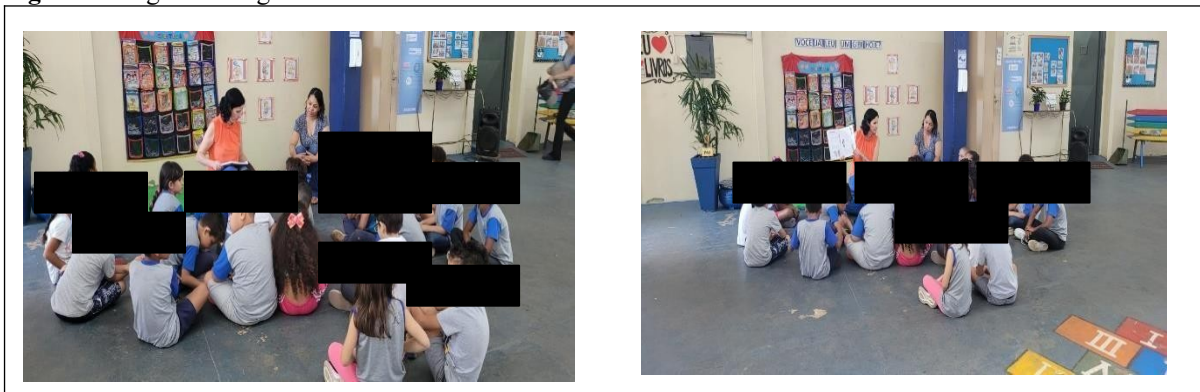
Figura 1: Registro fotográfico da atividade de leitura “ A escolha do nome”

Dessa forma, para que as atividades sejam significativas, a preceptora responsável desenvolve suas ações pedagógicas pautadas em atividades lúdicas, o que possibilitou abordar, além da aprendizagem do nome, a significação do sobrenome. Para isso, ao iniciar a sequência didática, é realizada junto aos alunos, a construção da pauta na lousa, que organiza o desenvolvimento das atividades a serem realizadas ao longo da semana de aula. Após a construção da pauta, as crianças são conduzidas ao pátio da unidade escolar para o momento de leitura do texto “A escolha do nome”, presente no livro didático do aluno, o que possibilitou a realização de intervenções pedagógicas a respeito da leitura e dos acontecimentos que ocorrem na narrativa do livro, onde as crianças tiveram a oportunidade de expressar suas percepções sobre a história, conforme ilustrado na figura 1.